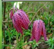
Рідкісні та зникаючі рослини