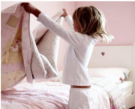
Я застеляю ліжко Я застеляв(ла) ліжко