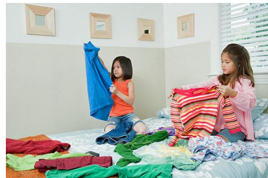
Я складаю речі Я складав(ла) речі