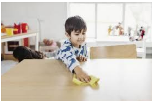
Я витираю пил Я витирав(ла) пил