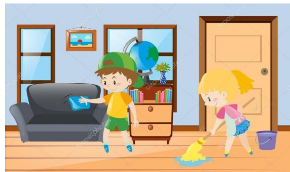
Я прибираю кімнату Я прибирав(ла) кімнату